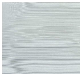
310 RAL 9010