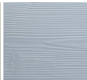
330 RAL 7047