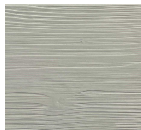
320 RAL 1013