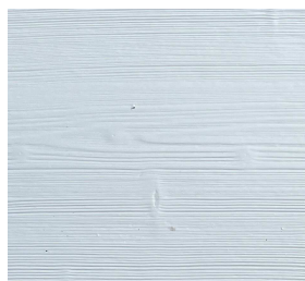
300 RAL 9016