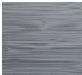
340 RAL 9006